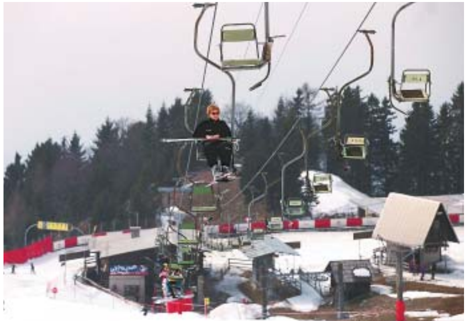
Se Krvavcu obetajo boljši časi?

Te bi morale prve temelje dobiti s podpisom pisma o nameri med občino Cerklje in Uniorjem Zreče na septembrski seji občinskega sveta, vendar pa zaradi nekončanih pogajanj z banko predstavnikov Uniorja ni bilo v Cerklje. "Žal mi je, da se banka in Unior še nista uspela uskladiti o ceni, vsi pa si želimo, da bo do dogovora čimprej prišlo. Unior Zreče kot novi lastnik RTC Krvavca bi bila edinstvena priložnost za nov zagon turizma v občini. Unior se je izkazal kot dober lastnik že na Rogli in ne dvomim, da bi bilo na Krvavcu kaj drugače. Upam, da ne bodo SKB banko premamile kakšne ponudbe iz tujine, saj se zavzemam za slovensko lastništvo, predvsem zaradi dejstva, kako je zamrlo smučišče Golte, potem ko je