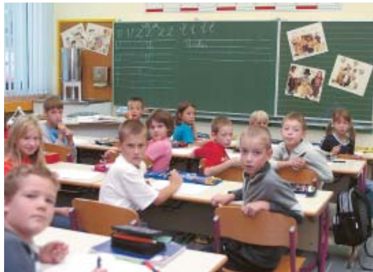
V šolski dvorani bo po novih načrtih jedilnica. Za letošnje šolsko leto smo s pregrado dobili dve manjši učilnici za učence drugih razredov.

Ali šolska reforma zahteva le novo pohištvo in prostore ter povzroča kup organizacijskih težav ali pa že sama po sebi prinaša večjo kakovost osnovnega izobraževanja?