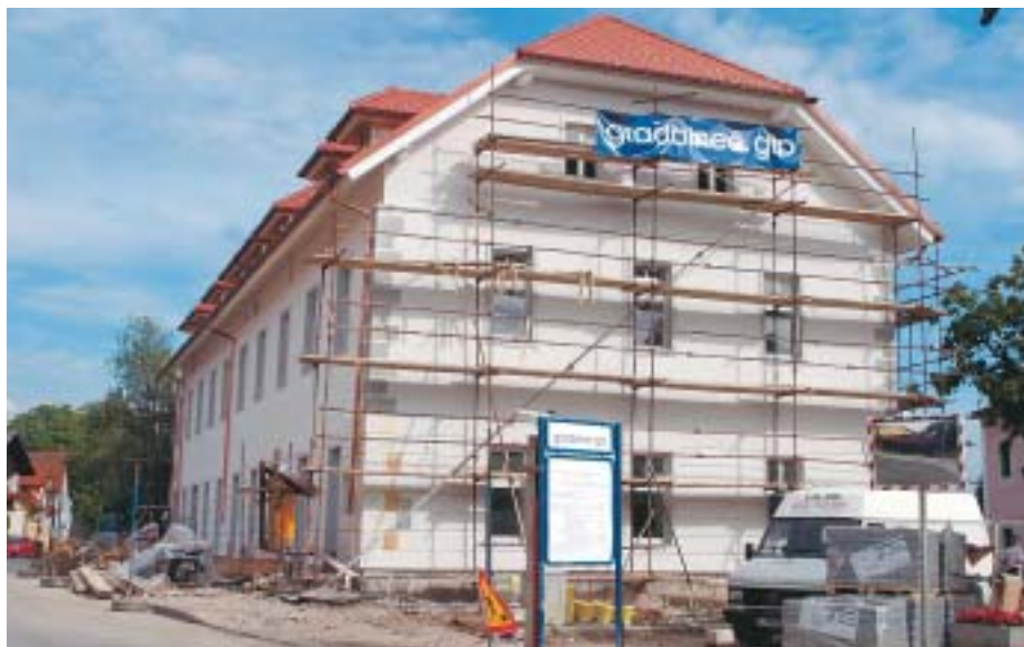
Občinska uprava se bo v nove prostore selila konec oktobra.

in s splošno zobno ambulanto. Dela bo izvajalo podjetje Gradbina GIP, ki je privolilo v naš razpisni pogoji, da plačilo del kompenziramo s tremi hektarji zemljišča v Šmartnem v vrednosti 253 milijonov, kakršna je bila sodna cenitev. Tako smo podpisali dve pogodbi. Prva je za izvedbo gradbenih del tretje faze brez zunanje ureditve, opreme in inštalacij v vrednosti 490,3 milijona tolarjev. Istočasno v dogovoru z GIP-om pripravljamo pismo o nameri o izgradnji doma starejših občanov in varovanih stanovanj v Šmartnem. V tej pogodbi je klavzula, da občina ostaja desetodstotni solastnik zavoda doma ostarelih, s čimer bomo soinvestitor pri izgradnji doma. Tako bomo s skupnimi močmi javni zavod ustanovili, poskusili bomo pridobiti koncesijo in soinvestitorje. Če bo vse potekalo po načrtih, pričakujem, da bomo na tem zemljišču pridobili še druge so-