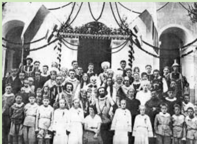
S prve gledališke predstave kulturnega društva Adergas - igra Slehernik iz leta 1938.