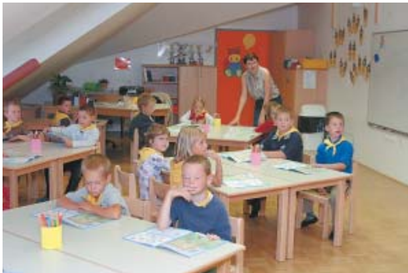
Zaradi prostorske stiske v šoli smo preuredili telovadnico in medijsko sobo v novem vrtcu v zelo prijetno in uporabno učilnico prvega razreda devetletke.

Prvega septembra smo v dodatnih prvih razredih sprejeli šestletne otroke, ki bodo v osnovno šolo hodili devet let. S tem smo sklenili prvi del nekajletnih priprav, v katerih smo uvedli nekatere nove predmete, izobrazili učitelje in razširili razmišljanja o nalogah šole.