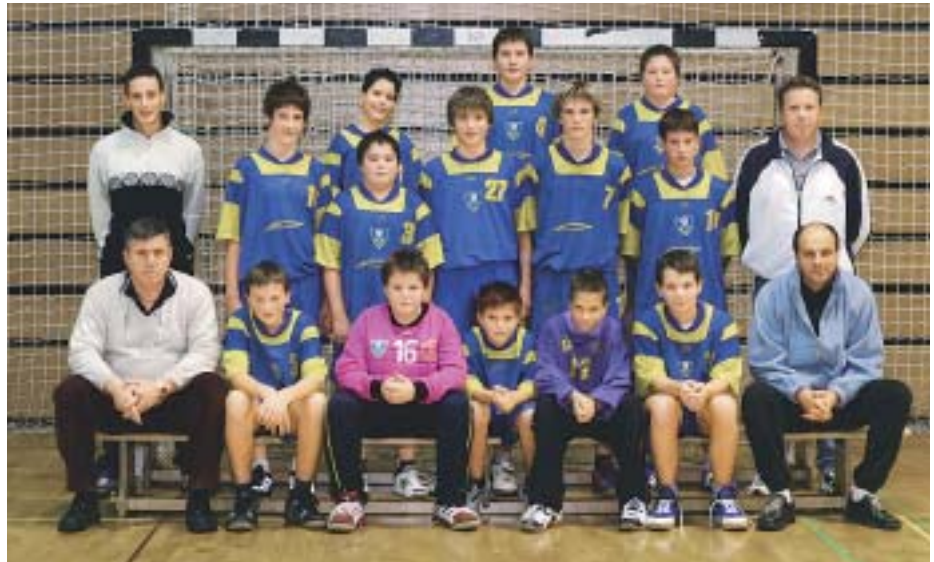
Ekipe starejših dečkov

Kakšni so bili cilji in kako kaže? Cilji so bili s člansko ekipo uvrstiti se na 7. do 10. mesto,