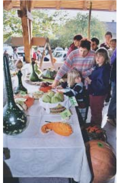
Veliko pozornosti obiskovalcev v Cerkljah so bile deležne bučke živopisnih barv.