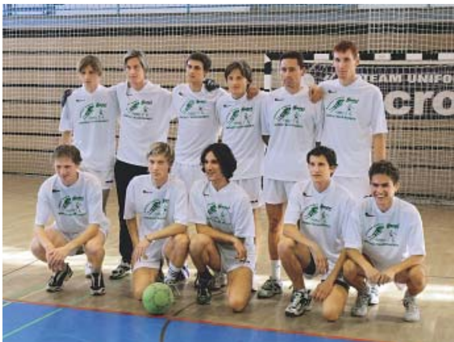
Na nogometnem turnirju so se izkazali tudi smučarji skakalci.