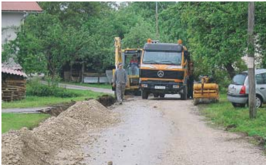
Obnavljanje glavne ceste na Cerkljanski dobravi.

"Zavedam se, da so k tej nagradi še največ pripomogli občani občine Cerklje, še posebej pa vasi Cerklje, ki so med letom v večjem delu Cerklj skrbeli za urejenost svojih vrtov, balkonov s cvetjem, gostinci so dodali svoje z gostoljubnostjo, osnovna šola pa z rednim urejanjem zunanjih površin in parka. Kako bomo v prihodnje sodelovali na tem tekmovanju, pa bomo občane seznanili v kratkem," pravi župan. S.Š.