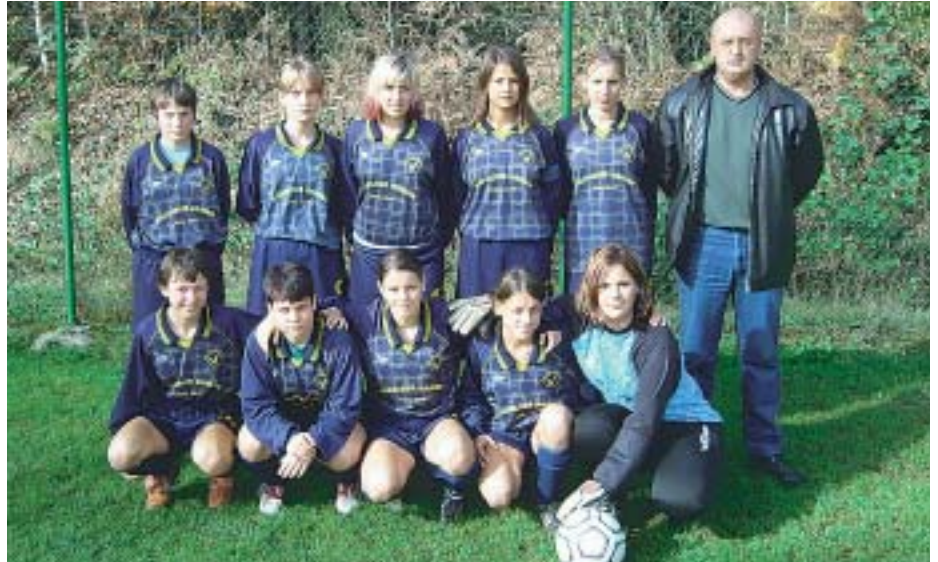
Deklice U16 so jesenske prvakinje.