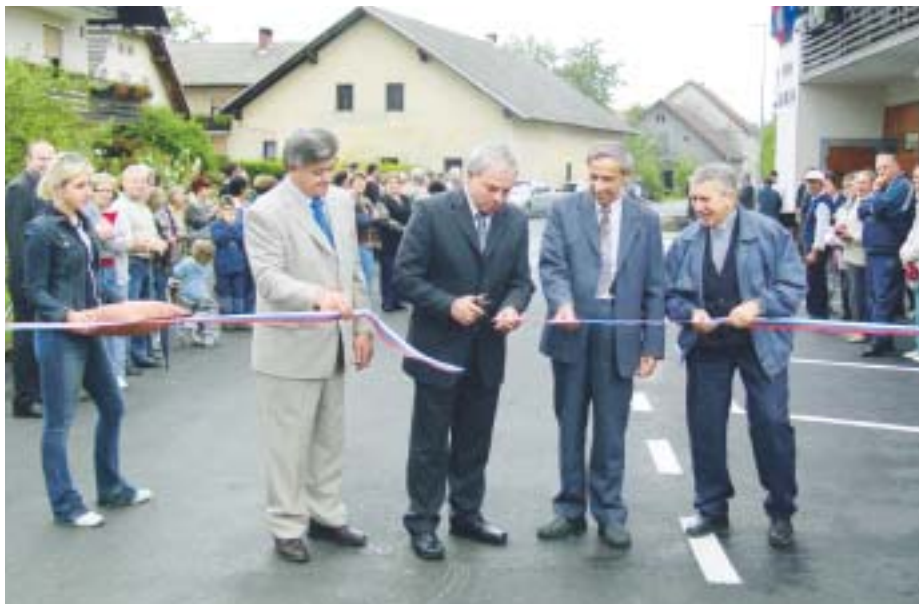
Rezanje otvoritvenega traku v centru Velesovega.