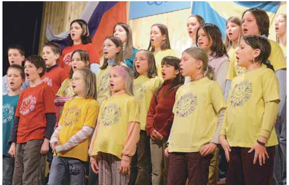
Otroški pevski zbor Osnovne šole Davorina Jenka.

- V maju smo gostili dva ugledna nizozemska pevška zbora, Beeker Liedertafel in slo-