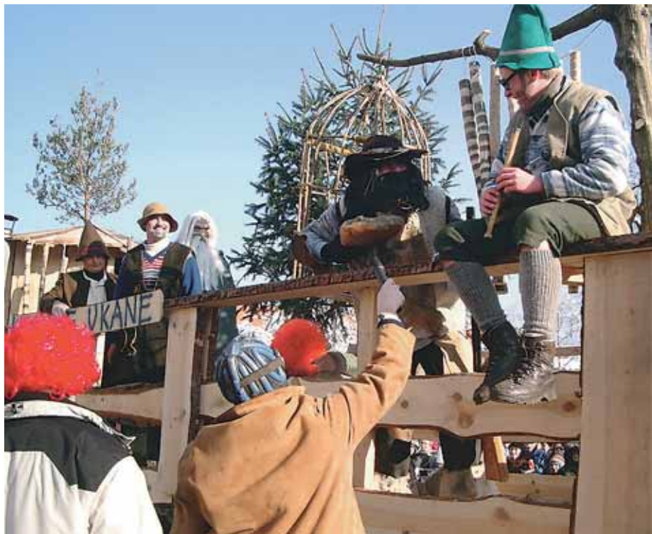
Kekčeva dežela po zaloško.

Kot običajno je povorko vodila njihova maskota - krava, ki je letos sodelovala pri biopridelavi pridelkov z računalniško vodenim plugom in ekološkim pogonom. Na drugem vozu so v obliki firme Kresniči predstavljali gradnjo šiptarske ambasade v Sloveniji. V Mavčičah so pripravili voz Agrokšeft, v Smledniku so pripravili voz s pokopališčem propadlih firmi kot so TAM, Tekstilindus, Živila, Planika, Mebles, Gorenjski sejem ... Na vozu iz Mlake pri Komendi so se pozabavali s prepovedanim klanjem na kmetiji, Voklanci so pripravili tudi voz z rondojem in