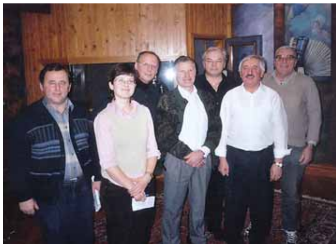
S snemanja pesmi Crkljanska fara v Avesnikovem studiju.