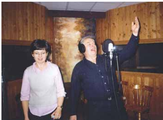
Župana je petje povsem prevzelo.