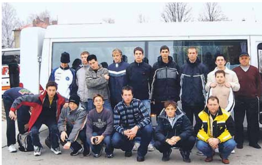
Kadetsko - mladinska ekipa, ki je sodelovala na turnirju v Ostravi.

Mlada članska ekipa v 3. slovenski ligi še ni