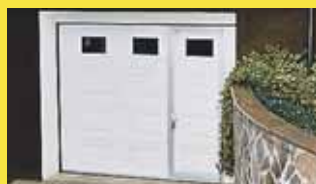
Garažna dvizna vrata izdelana po meri.