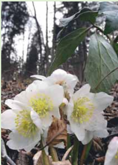
Na naslovnici: Pomladni teloh