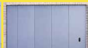
”Snake”stranska drseča vrata