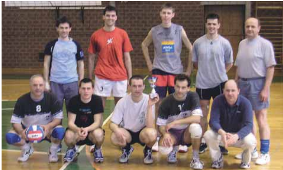
Članska ekipa je bila prva v gorenjski ligi.

Septembra so ob občinskem prazniku na igrišču v Adergasu organizirali turnir, na katerem so poleg domače ekipe nastopila še Trata in Astec Triglav (mlajša selekcija). Zmagala je Trata, ki je v razburljivem finalu tesno ugnala domači Adergas. Kranjski Triglav je bil tretji. V ženski kategoriji sta nastopili le domači ekipi - mlajše igralko so se pomerile s starejšimi. "Glede na številno udeležbo naših članov na turnirju, predvsem pa mladine, mislim, da se nam za nadaljevanje tradicije igranja odbojke v našem društvu ni treba bati," ugo-