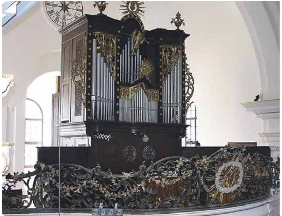
Vsakoletne obnove dotrajanih orgel v velesovski cerkvi so postale predrage.

Nove orgle bodo stale približno 40 milijonov tolarjev. ”Odvisni smo od vsakoletnih prispevkov občine in prostovoljnih prispevkov faranov. Žal pa je naša župnija majhna, kar pomeni, da dlje časa zbiramo denar kot v večjih župnijah,” pojasnjuje Miroslavič, ki tokrat sploh ni več poskušal dobiti sredstev od države. ”Prevečkrat smo že ”padli” skozi. Velikokrat sem dal skozi dolge procedure, zbiral dokumenta-