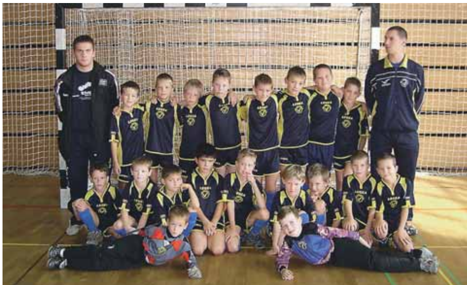
Ekipa dečkov U-8.

Nogometni klub Velesovo začnja s spomladanskim delom nogometnih ligaških tekmovanj.