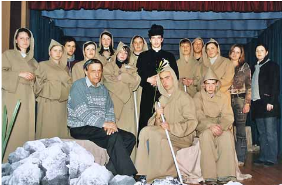
Igro Ugaslih oči so doslej igrali osemkrat.