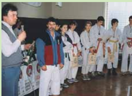
Arhivski posnetek iz leta 1995

V zadnjem obdobju karate vse bolj postaja tekmovalni šport in vse manj pomeni večščino, zato je malo pravih učiteljev, ki karate trenirajo kot večščino, to je usklajenost uma in telesa.