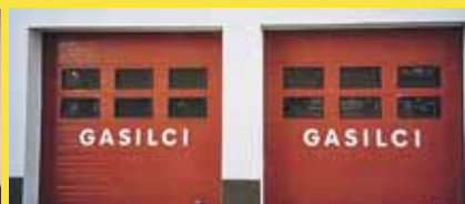
Industrijska vrata - dodatna varovanja proti poškodbam